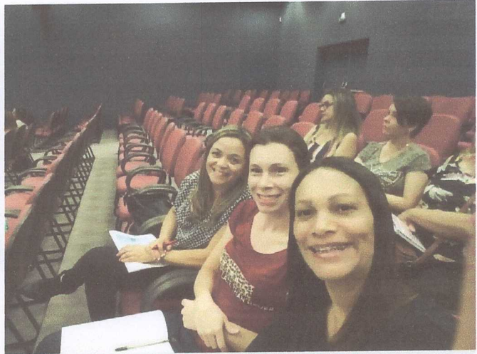
PEDAGOGIA DOS SONHOS VM