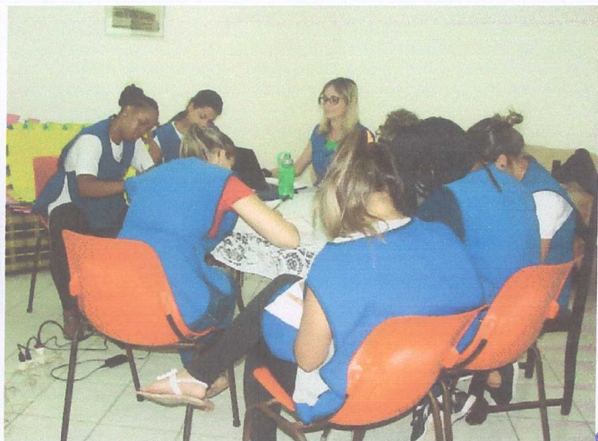
TFC ADI's VM