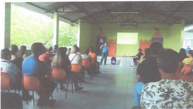
REUNIÃO DE PAIS JS