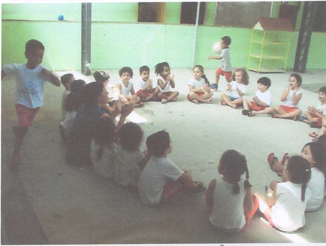
BRINCADEIRAS COM INTERAÇÃO VM