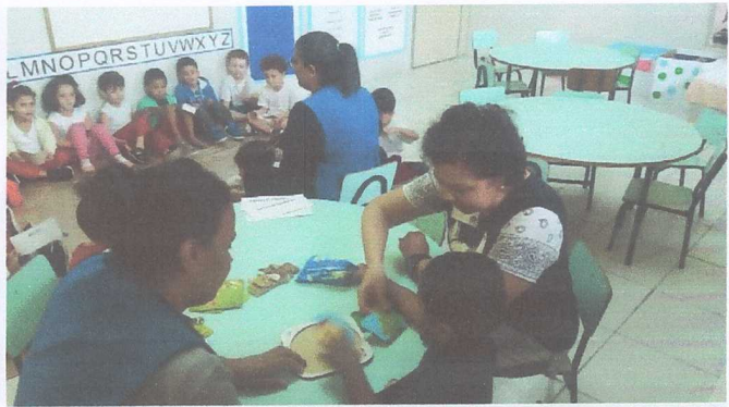
SALA DE RECURSO JS