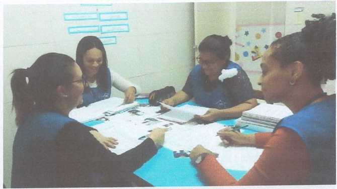
TFC PROFESSORAS JS