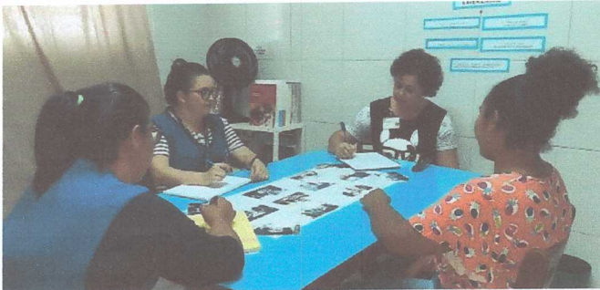
ATENDIMENTO À FAMÍLIA JS