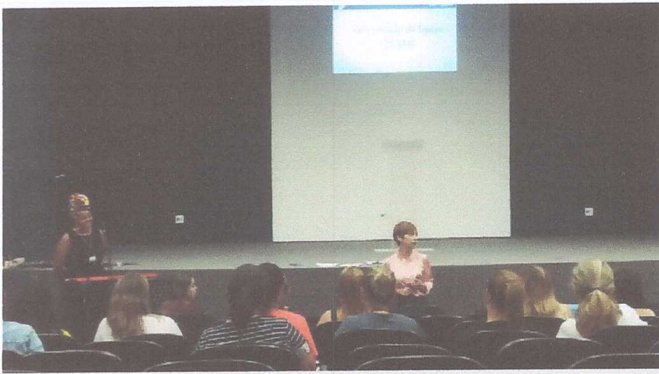
PEDAGOGIA DOS SONHOS VM