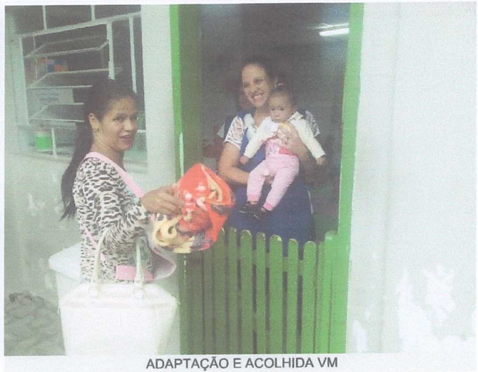
ADAPTAÇÃO E ACOLHIDA VM