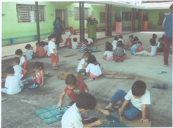
INTERAÇÃO E BRINCADEIRAS VM