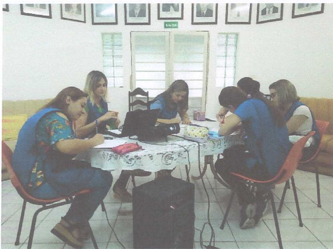
TFC PROFESSORAS VM