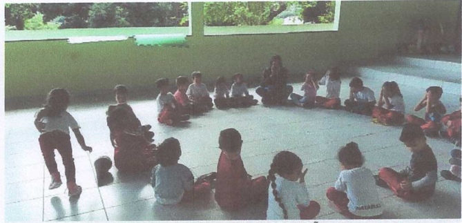
BRINCADEIRAS COM INTERAÇÃO JS